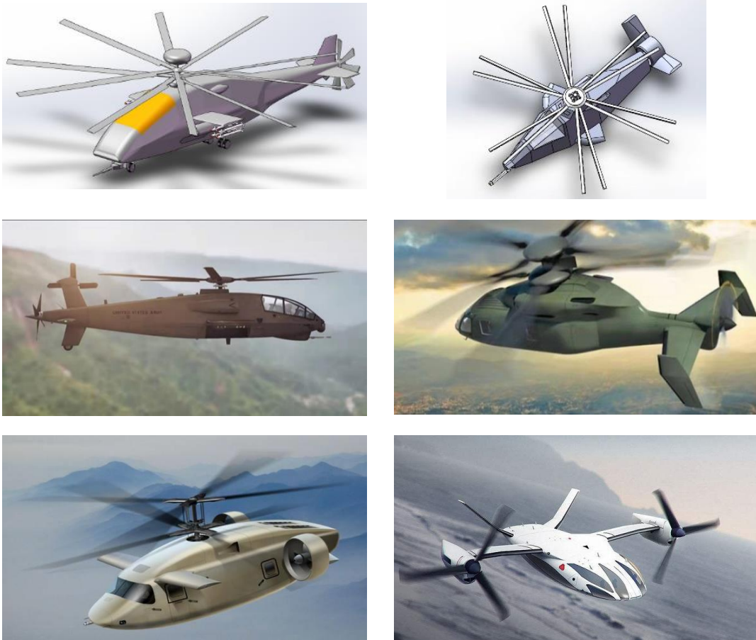
图 5 概念设计方案参考图